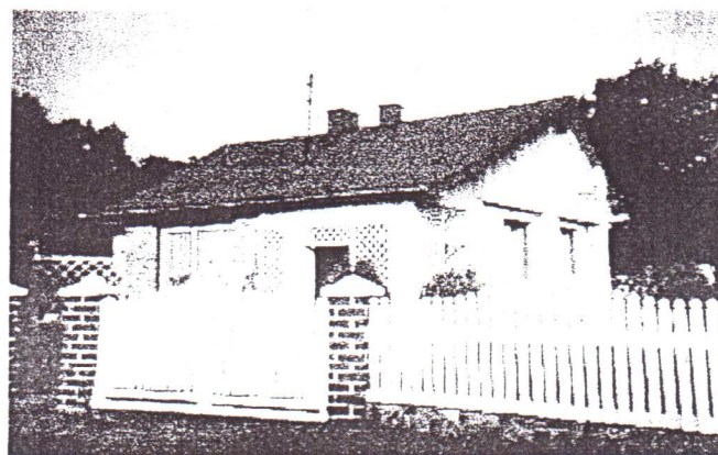
Dobles - dawny „mikołajek nauczycielski” własność państwa Cymbałek