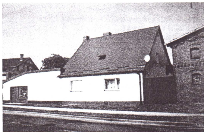
Wyremontowany budynek przy ul. Wolności 27 będący własnością Pani Ewy Gurdziel.