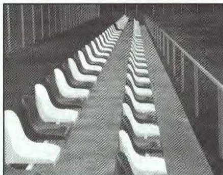
Mamy trybunę! W nowym sezonie kibice piłki nożnej zasiądą już na nowych trybunach na stadionie sportowym w Tychowie.

Dodatkowo w rozgrywkach prowadzonych jest wiele klasyfikacji indywidualnych (na najlepszego bramkarza, króla strzelców i najlepszego zawodnika). Organizatorzy i zawodnicy serdecznie zapraszają wszystkich kibiców piłki nożnej