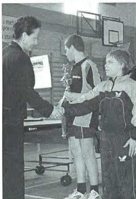
Wręczenia nagród najlepszym zawodnikom