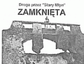
Budowla grozi zawaleniem !!!

Uwaga WIEŚ - MIASTO 27 czerwca o godz. 18.00 w sali widowiskowej GOK Tychowo odbędzie się spotkanie Wójta z mieszkańcami w sprawie konsultacji społecznych dotyczących nadania miejscowości Tychowo statusu miasta.