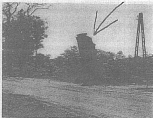
Proponowany przez poprzednika „pomnik przyrody” przy ul. Dolnej w Tychowie

Kierownik Referatu ds. Gospodarki Nieruchomościami, Budownictwa i Ochrony Środowiska w Urzędzie Miejskim w Tychowie.