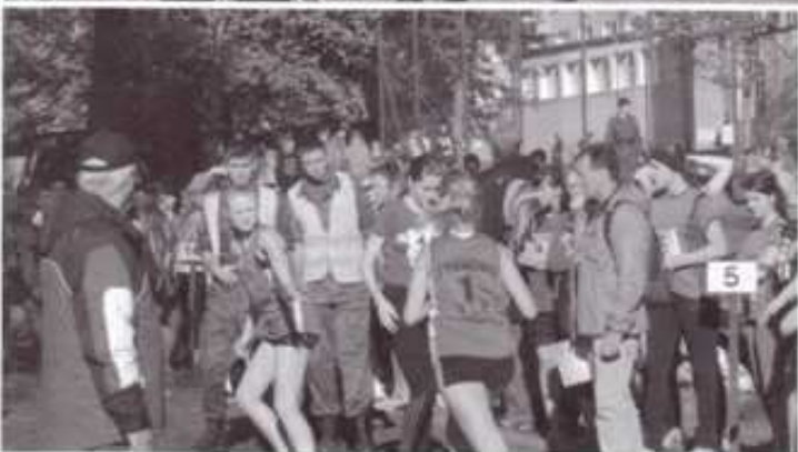
Dziewczęta z ZSP Tychowo w strefie zmian.