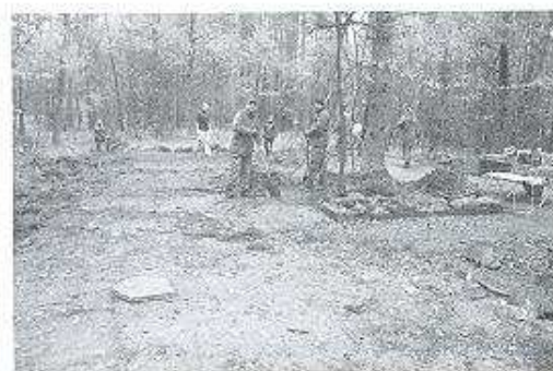
Foto relacja przedstawia oczyszczanie podmurówki oraz przedmioty odnalezione podczas usuwania roślinności.

Osoby które chciały by wesprzeć nasze działania prosimy o kontakt z koordynatorem prac Pawłem Urbaniakiem drogą mailową: pawek1981@vp.pl lub telefonicznie pod nr 513 059 596.