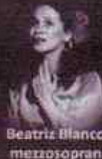
Beatriz Blanco mezzosopran