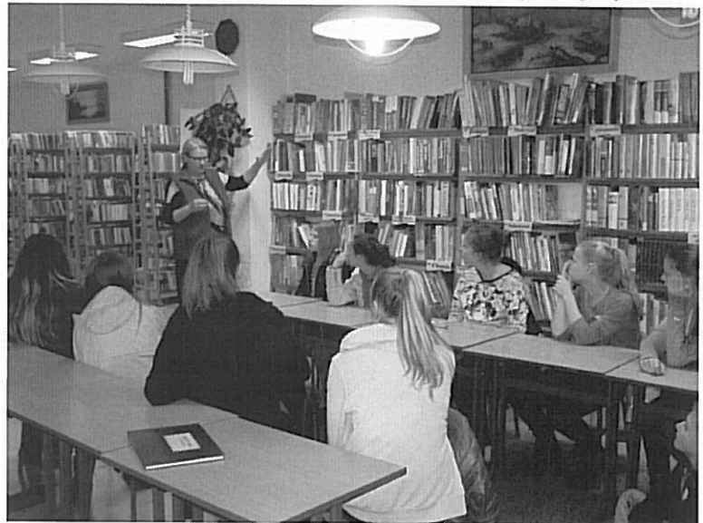
Na zdjęciach uczniowie klasy I a Gimnazjum na zajęciach w Bibliotece Publicznej.

Biblioteki przyjęły do wykonania w ramach programu 78 wspólnych działań, będą to m.in. lekcje i zajęcia biblioteczne dla uczniów, konkursy czytelnicze i plastyczne, wystawy, głośne biblioteczne czytanie i wiele innych imprez czytelniczych. Realizację programu rozpoczęto organizacją w Bibliotece Publicznej zajęć bibliotecznych dla uczniów wszystkich klas gimnazjalnych.