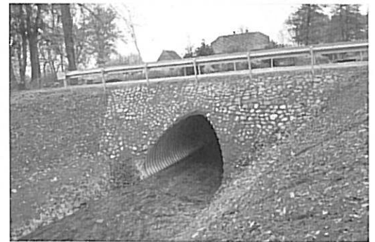
Wygląd mostu obecnie