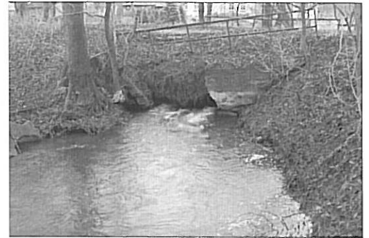
Wygląd mostu przed inwestycją

Przebudowa przepustu poprawiła bezpieczeństwo osób z niego korzystających w celu dojazdu m.in. do gruntów rolnych, zabudowy mieszkaniowej oraz zapewniła możliwość dotarcia służb ratowniczych do części mieszkańców Borzysławia jako widoczny efekt dobrej współpracy i współdziałania gminy z instytucjami szczebla powiatowego i wojewódzkiego.