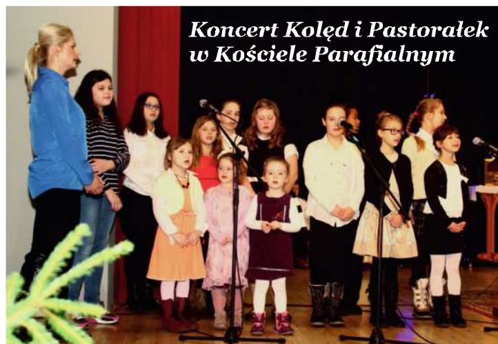
Koncert Kolęd i Pastorałek w Kościele Parafialnym