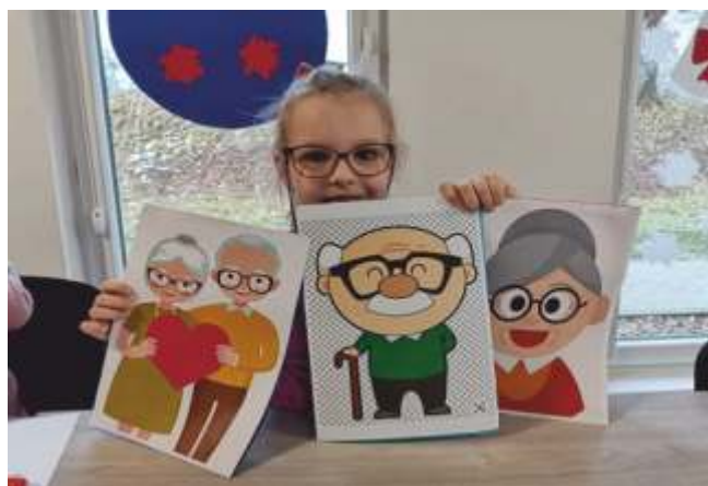
Świetlica w Bukówku