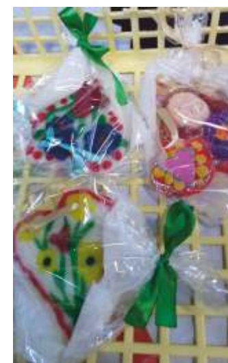
Świetlica w Warninie