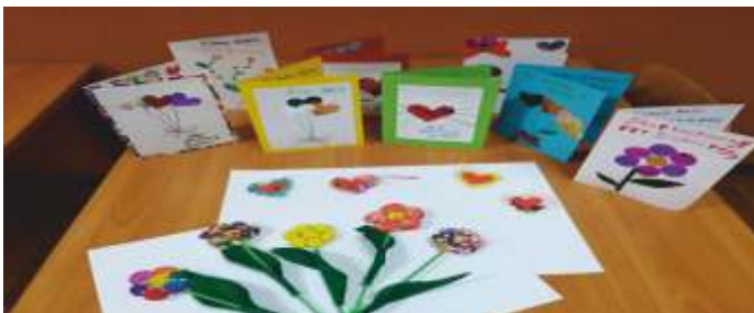
Świetlica w Sadkowie