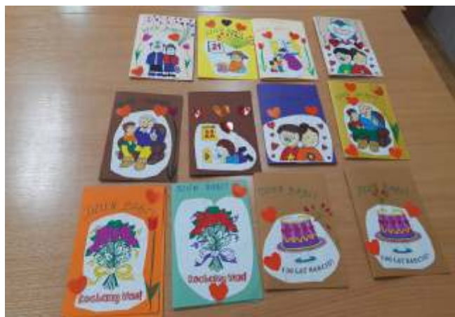
Świetlica w Smęcynie