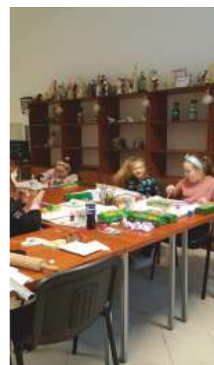
Świetlica w Dobrowie