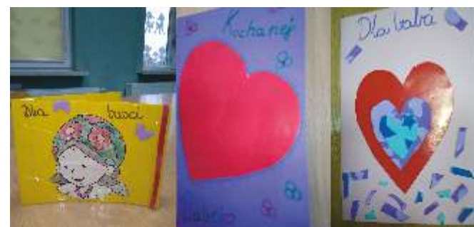
Świetlica w Pobądku

A. Węglarska promocja i reklama GOK w Tychowie