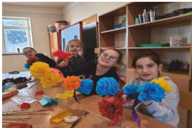
Świetlica w Borzysławiu