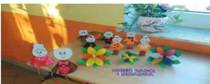
Świetlica w Kikowie