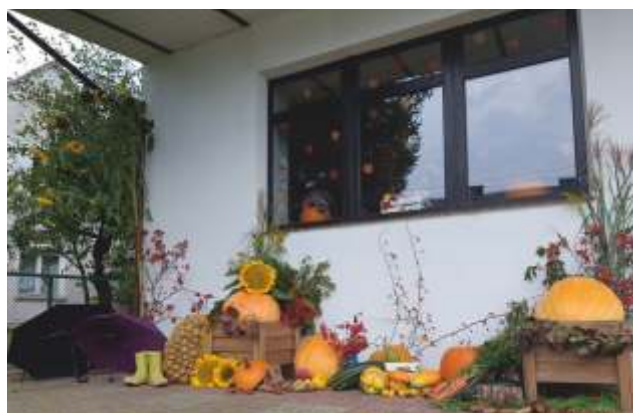
Świetlica w Borzysławiu