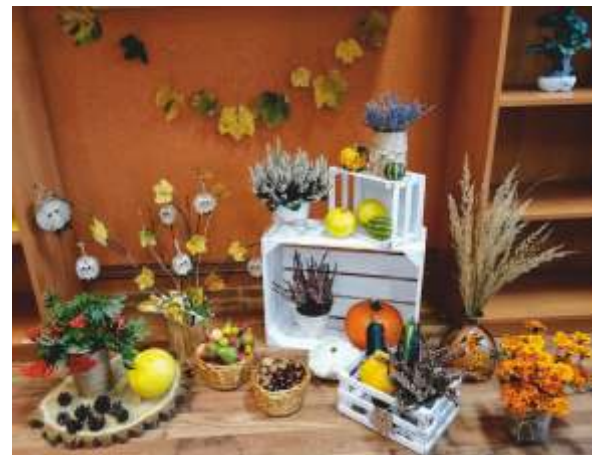
Świetlica w Sadkowie