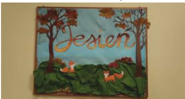
Świetlica w Trzebiszynie