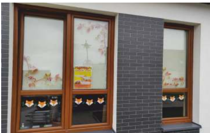
Świetlica w Trzebiszynie