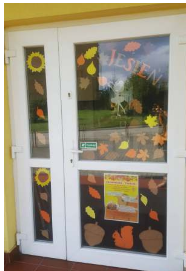
Świetlica w Dobrowie