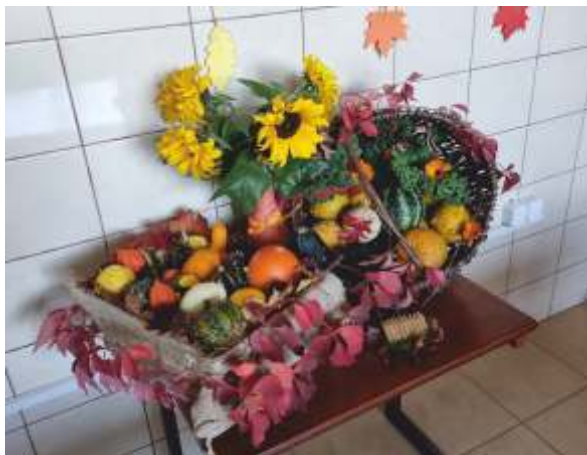
Świetlica w Kowalkach