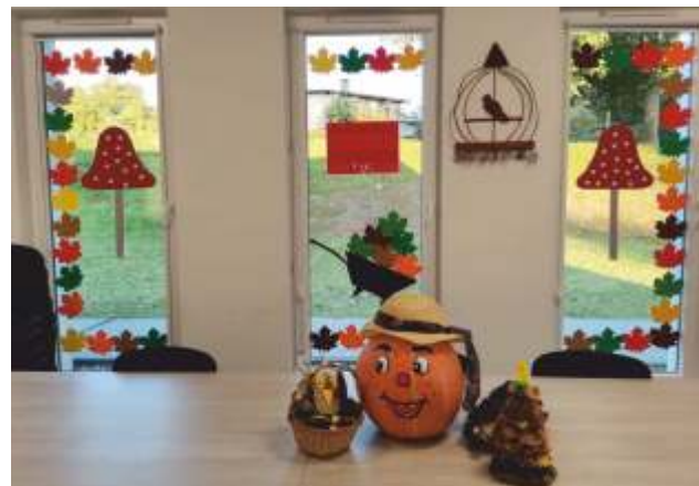
Świetlica w Bukówku