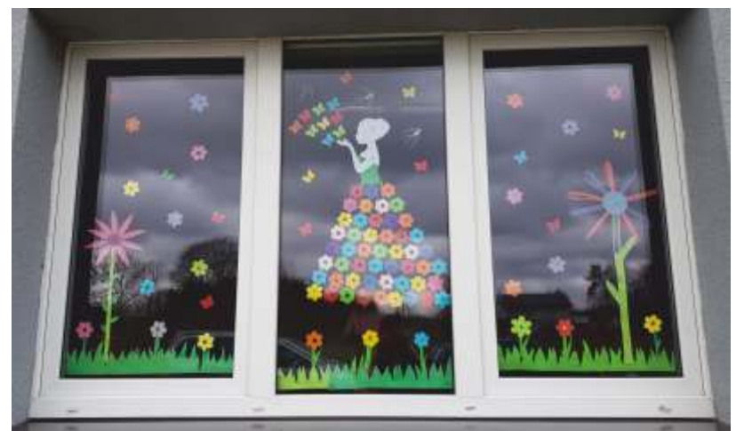
Świetlica w Kowalkach