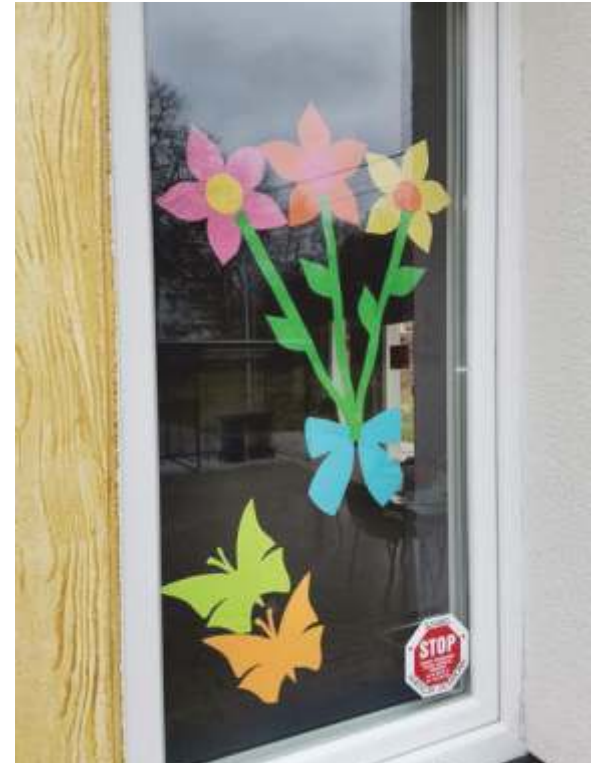
Świetlica w Bukówku