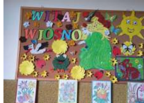
Świetlica w Tychowie