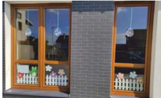
Świetlica w Trzebiszynie