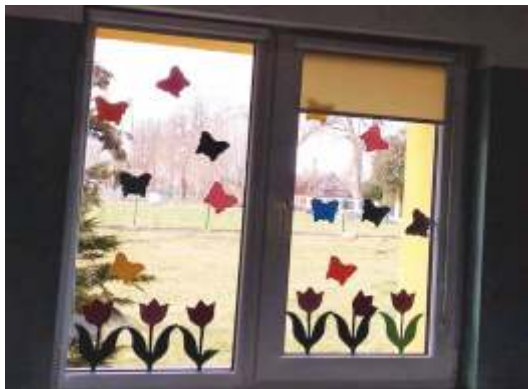
Świetlica w Pobądzu

A. Węglarska promocja i reklama GOK w Tychowie