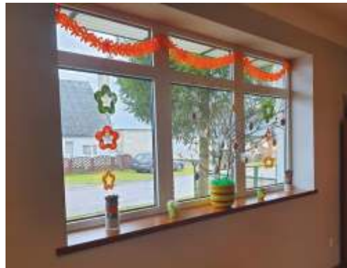
Świetlica w Borzysławiu