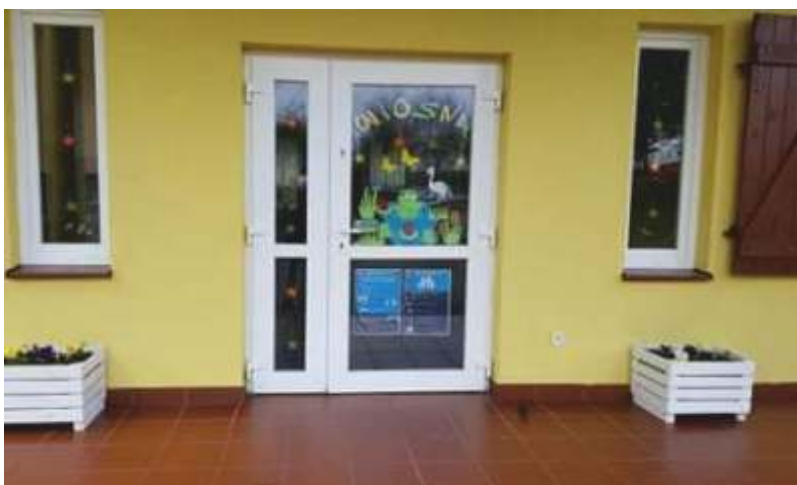
Świetlica w Dobrowie