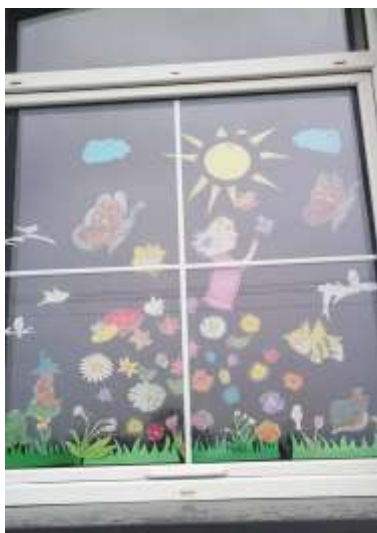
Świetlica w Warninie