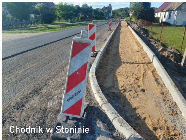
Chodnik w Słoninie