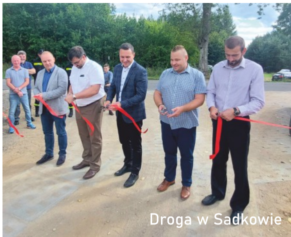
Droga w Sadkowie