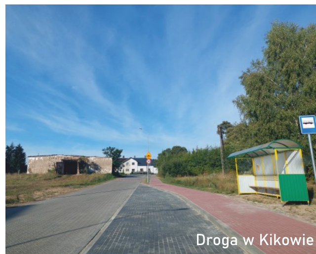
Droga w Kikowie