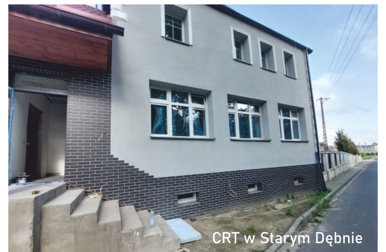
CRT w Starym Dębnie