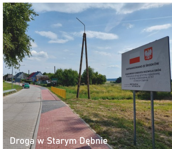
Droga w Starym Dębnie