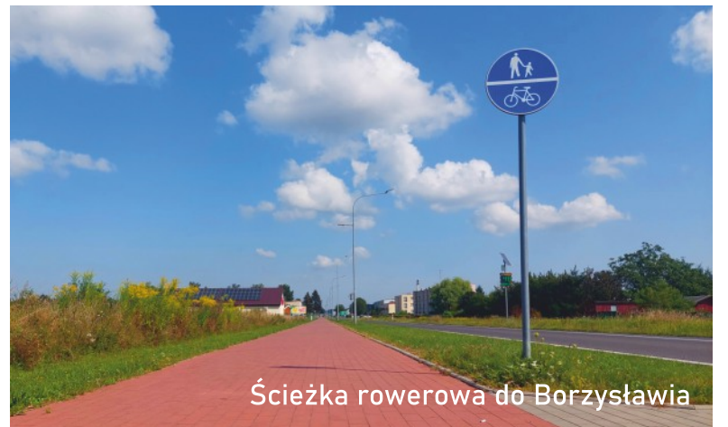
Ścieżka rowerowa do Borzysławia